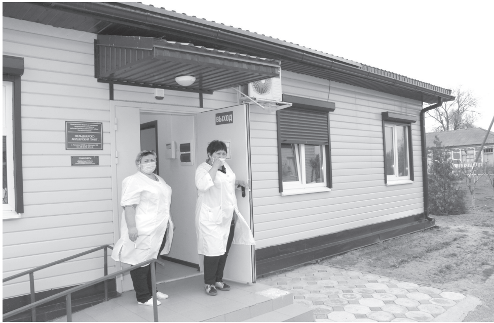
Фельдшерско-акушерский пункт в с. Тюльпаны

тие новых сосудистых отделений в двух городах области.