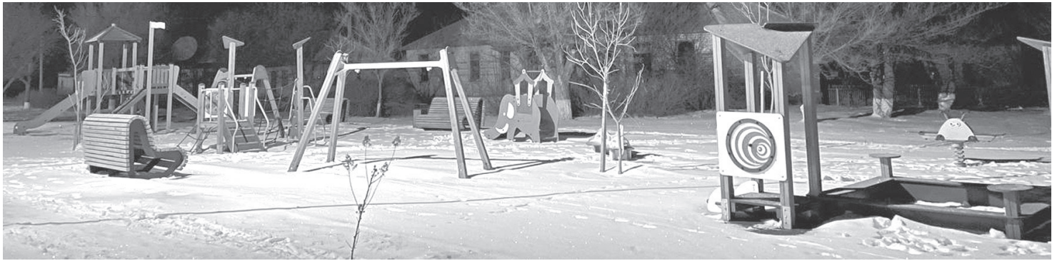
Пешеходная зона в с. Киселевке

сообщество ВКонтакте Администрация Фоминского сельского поселения