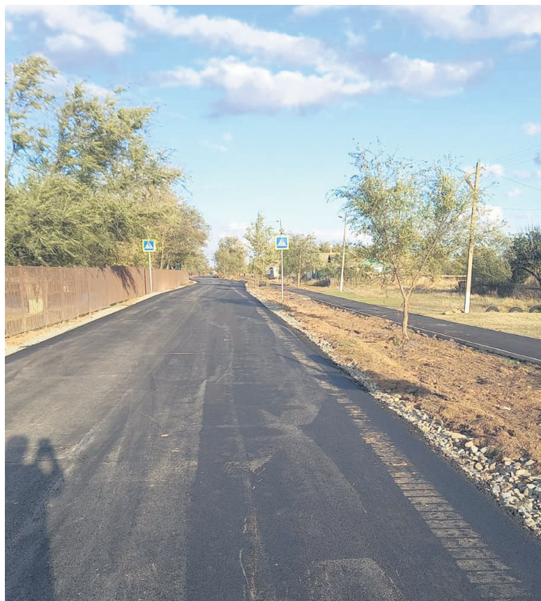
Автомобильная дорога и пешеходный тротуар по ул. Центральной (х. Фомин)

В течение всего года выполняется комплекс работ по зимнему и летнему содержанию автомобильных дорог, находящихся как в ведении министерства транспорта Ростовской области, протяженностью 220,6 км, так и в муниципальной собственности, протяженностью – 110,8 км (очистка автомобильных дорог от снега, россыпь противого-