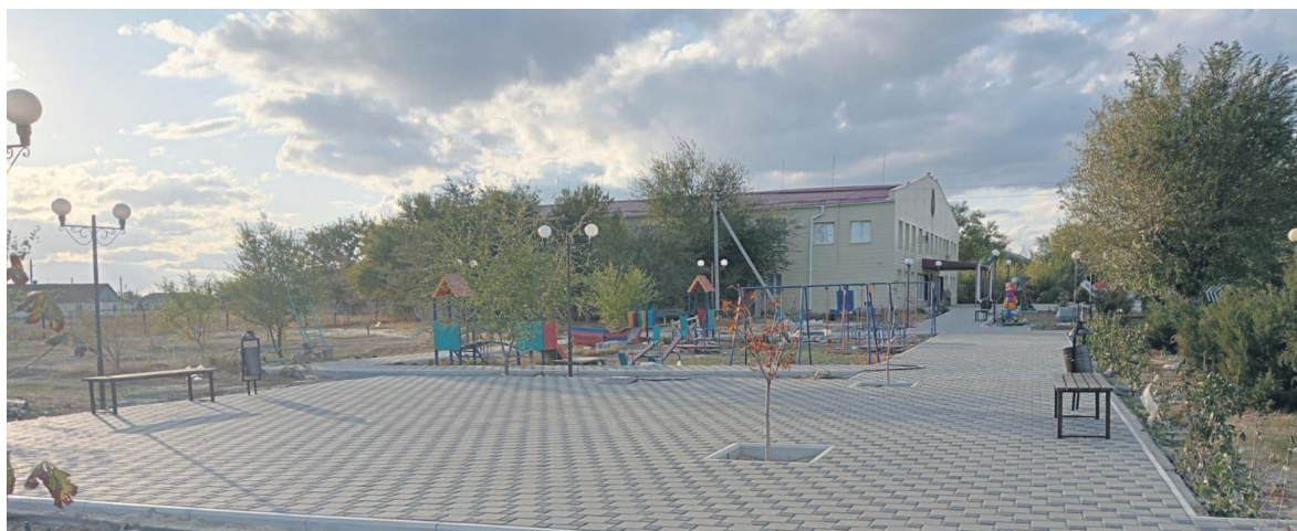
В с. Тюльпаны выполняются работы по благоустройству центральной части населенного пункта

Кроме того, администрацией Заветинского района были выполнены работы по устранению ямочности на муниципальной сети автомобильных дорог во 2