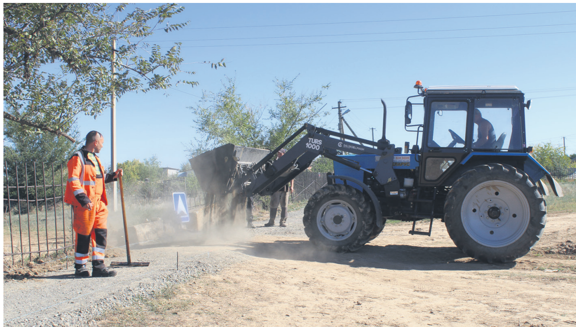
Тротуары по улицам Гагарина и Октябрьской (с. Федосеевка)

лоледных материалов, очистка средств обстановки пути (мосты, автопавильоны, дорожные знаки, сигнальные столбики и т.д.)