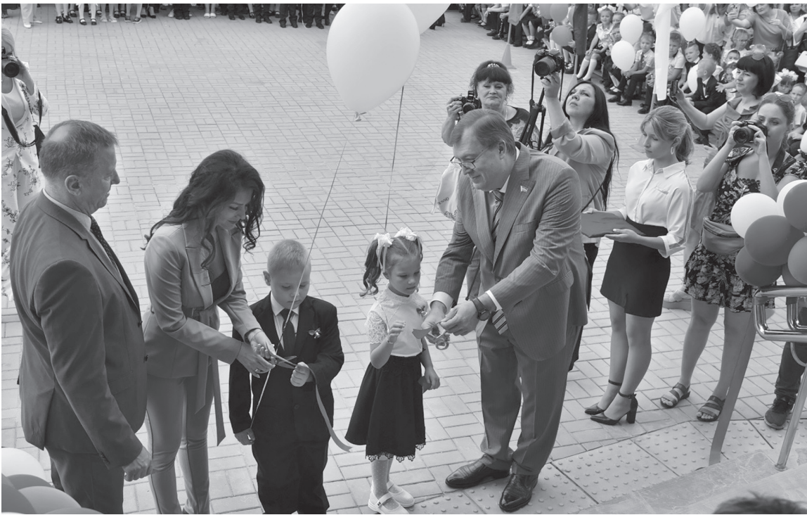
Школьное образование и комфорт «бюджетников» сейчас требуют особого внимания, считают донские парламентарии

– Мы проанализировали, как менялась в течение последних восьми лет ситуация с финансированием материального обеспечения школ и детских садов, и пришли к выводу, что объем средств, который мы выделяем, отстает от уровня инфляции, – пояснил председатель Законодательного Собрания Ростовской области Александр Ищенко. – Поэтому закладываем в закон жесткую привязку к уровню инфляции, для того чтобы все расходы были обеспечены бюджетным рублем.