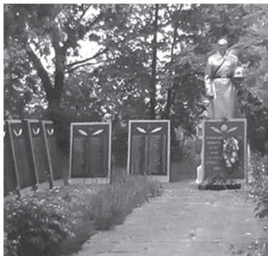
Братское захоронение. с. Заповитное, Каменско-Днепропетровский район, Запорожская область.

В период Второй мировой войны на территории Норвегии находилось 212 лагерей военнопленных, в которых содержалось около 100 тысяч советских