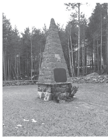
Норвегия. г. Оппдал. Памятник советским военнопленным