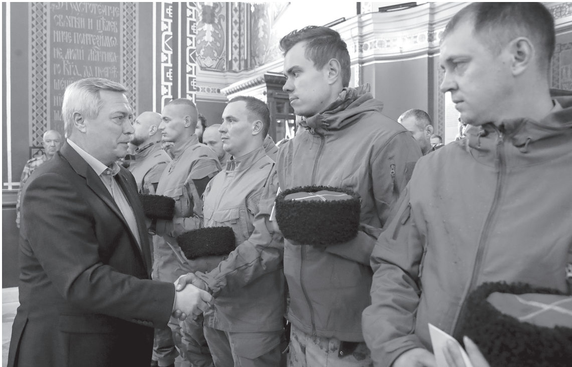
И сегодня на Дону воспитывают новые поколения казаков, любящих Отечество и служащих ему

– Выставки, фестивали, соревнования, викторины, лекции – вот основные виды мероприятий, посвященных Году атамана Платова, – отметил губернатор. – От организаторов каждого из них требуется, чтобы это были настоящие события – интересные, живые и одинаково привлекательные и для молодежи, и для старшего поколения.